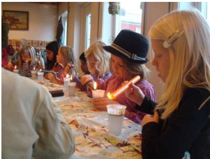
SFO – vinterhygge.