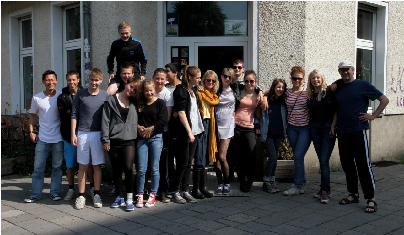
Forsinket postkort fra Berlin fra 9. klasse.