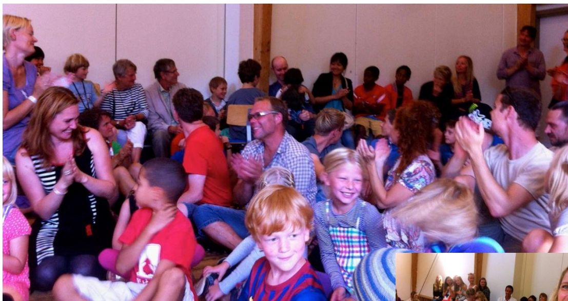
Alle er spændte og glade. Der klappes af de nye børnehaveklassebørn.