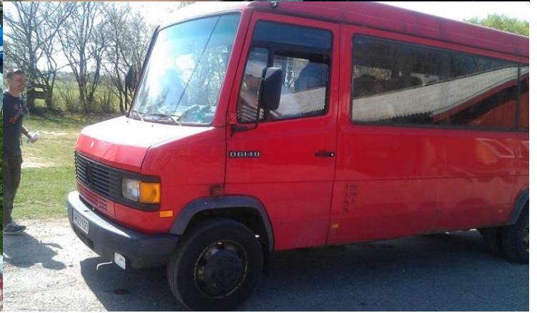
drengene støver - pigerne prøver - solcreme smøres - bussen køres