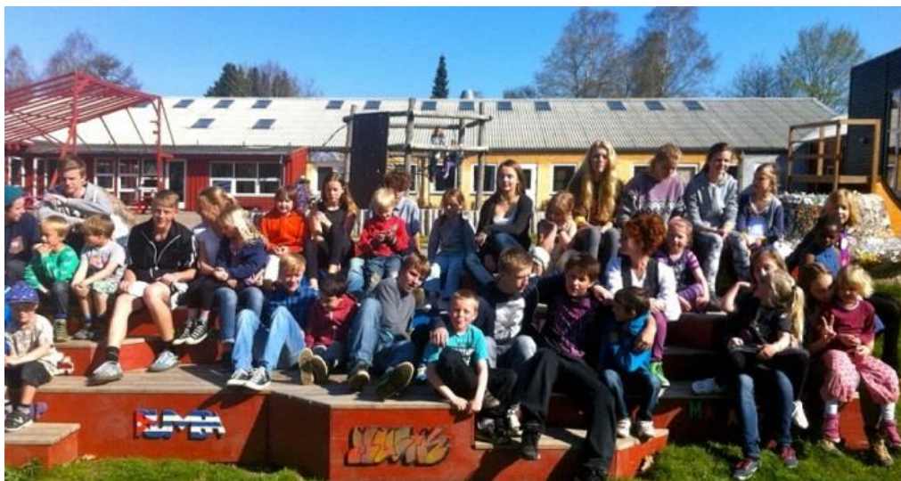
Endelig sammen igen!