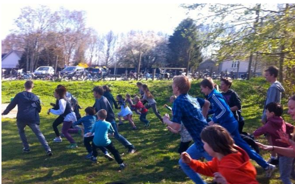
Tine, 0. og 8. kl. leger