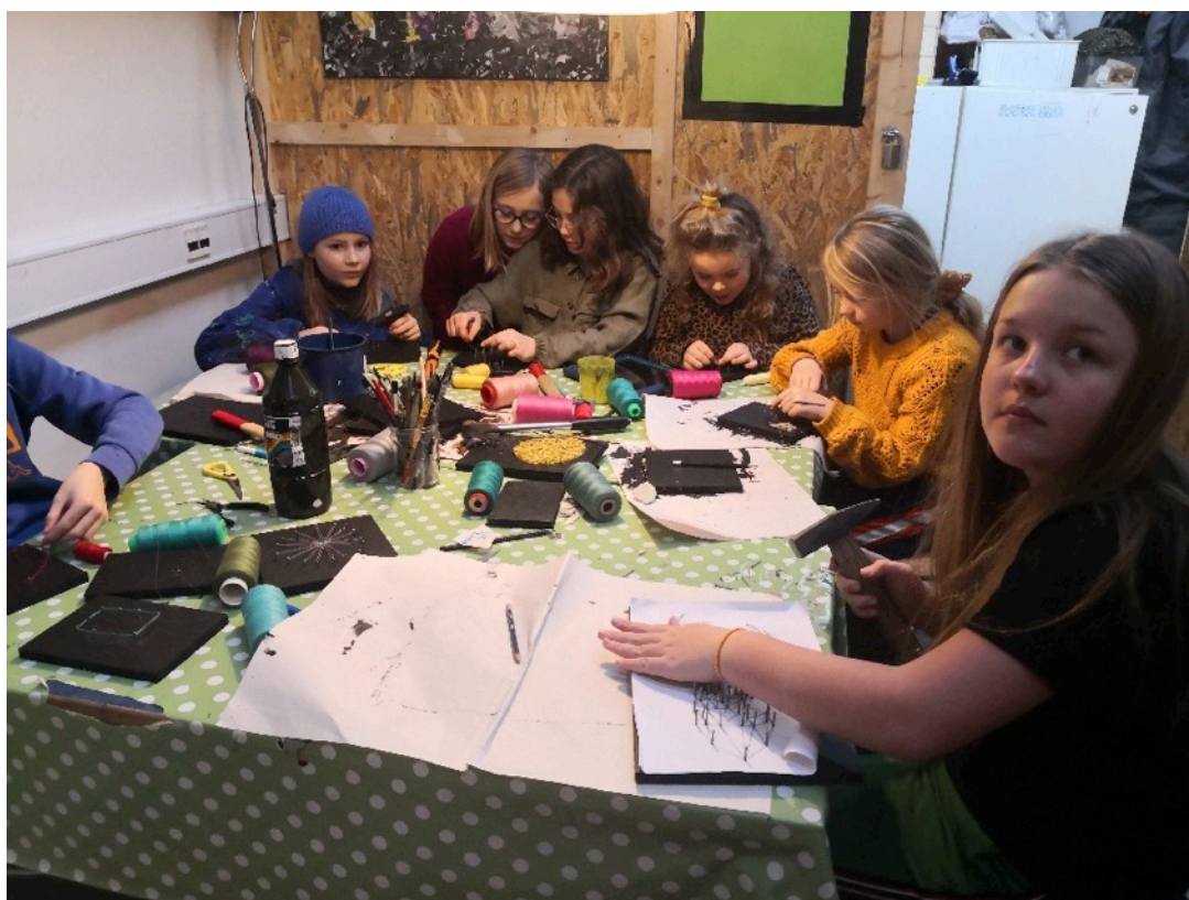
Kunstuge i SFO