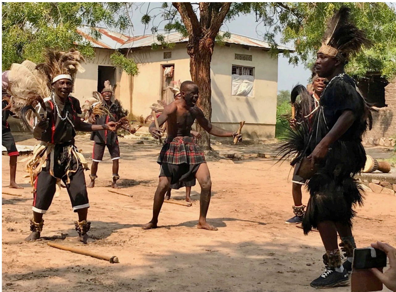
Billeder fra 8.klasse i Tanzania – billederne taler vist for sig selv, alt meldes godt dernedefra 😊