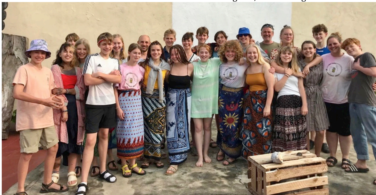
De fleste billeder er fra Buhjora – ovenstående fra Bagamoyo (hvor nødpakken vist blev åbnet)