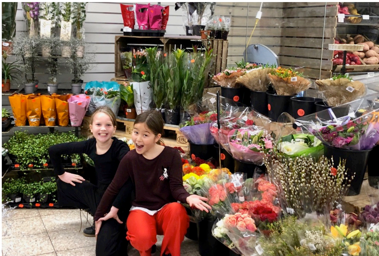
Blomsterpiger fra 4.klasse i praktik –