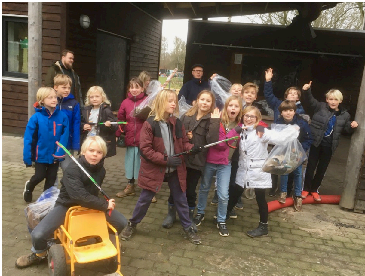
3.klasse på skraldeindsamling