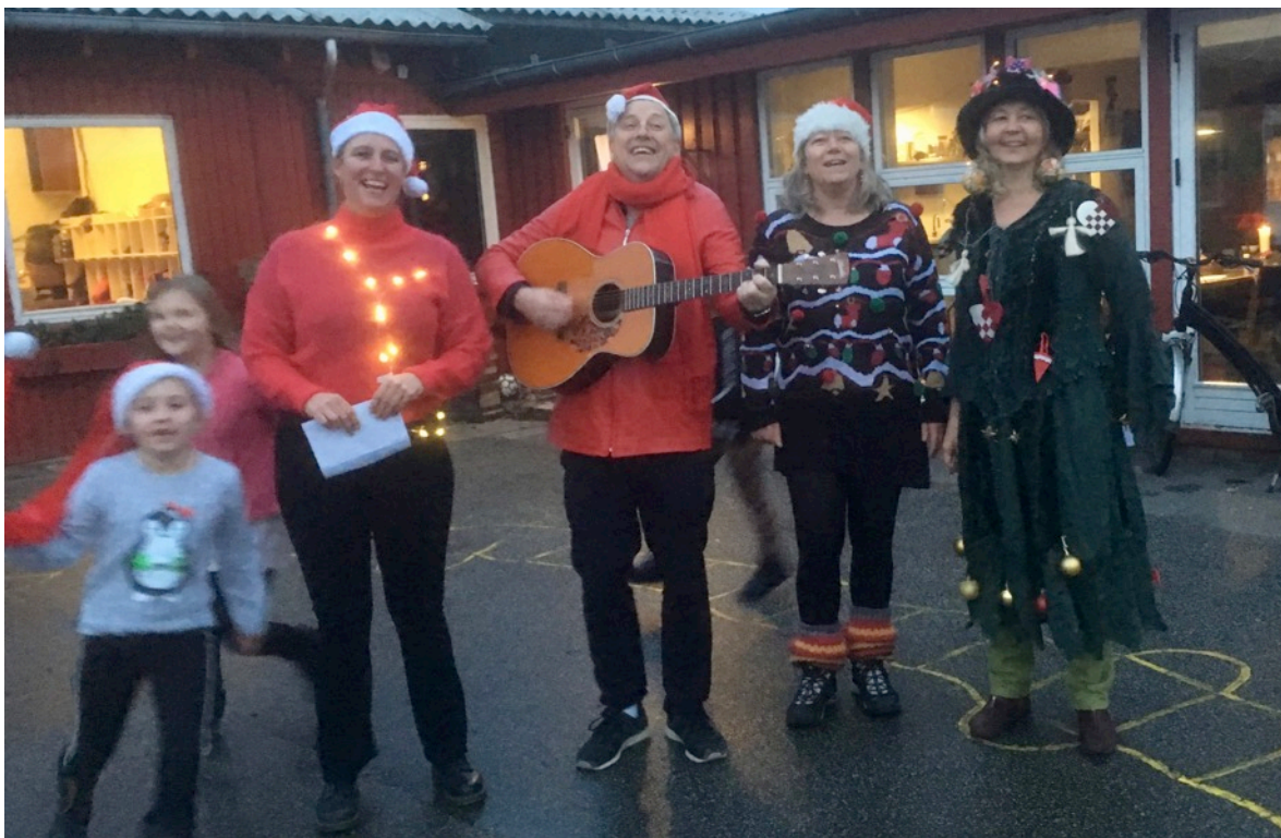
Tidlig morgen - Julesange leveret af Julekonerne og en hane fra lærerværelset – man kan da ikke undgå den gode julestemning på skolen!