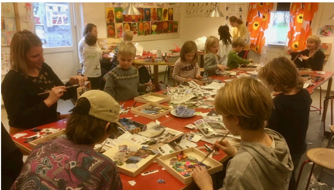
Værkstedsbilleder – kig ikke for grundigt på billederne, da julegaver er i fare for at blive afsløret☺