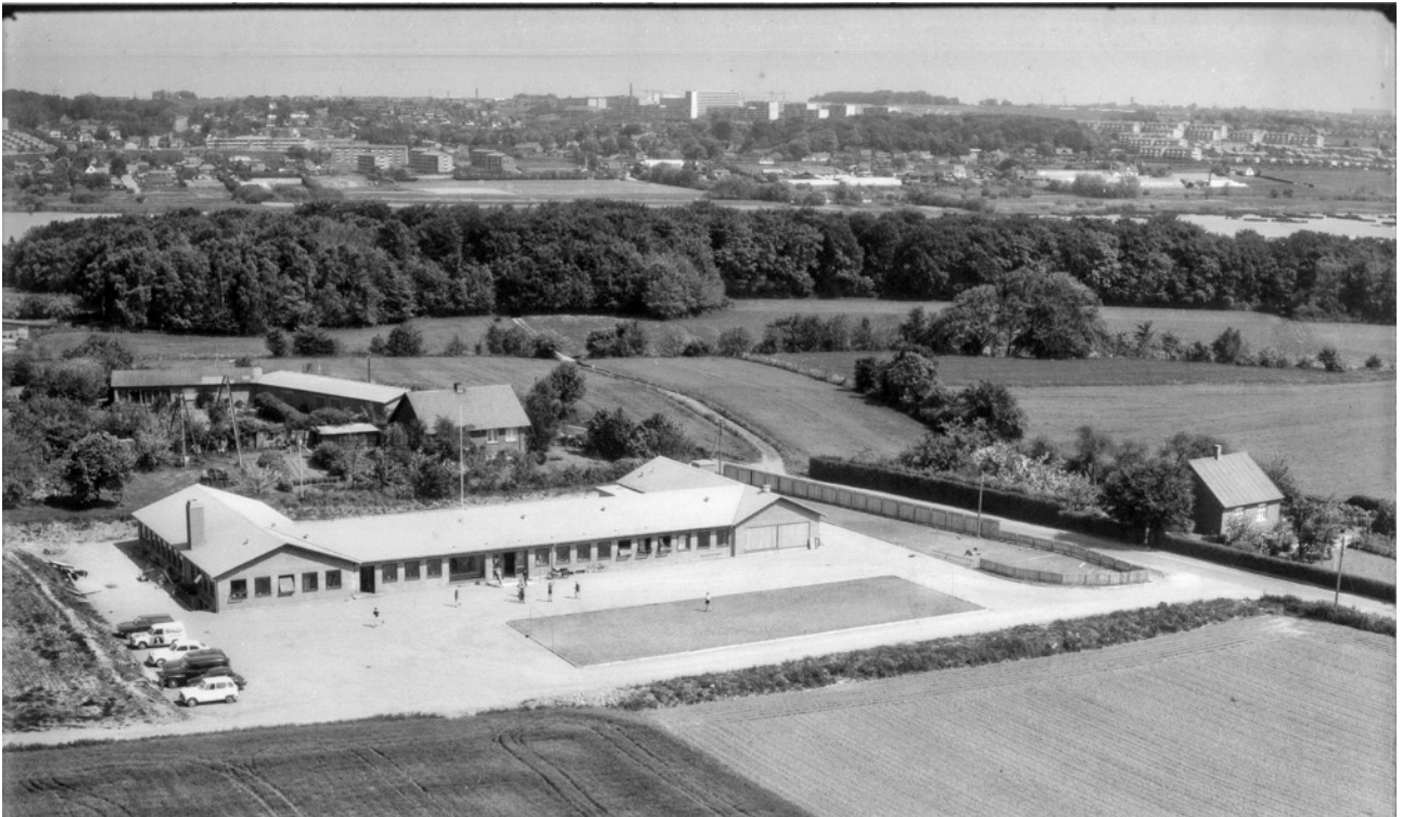
ÅRHUS FRISKOLE ÅR 1970 - ca - tak til julemanden for billeder