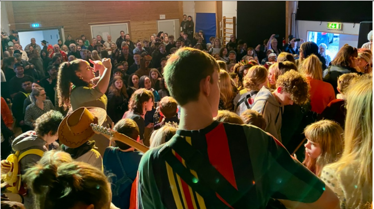
Tak 7.klasse for en fantastisk Fastelavnsfest – her set oppe fra Big Band-podiet