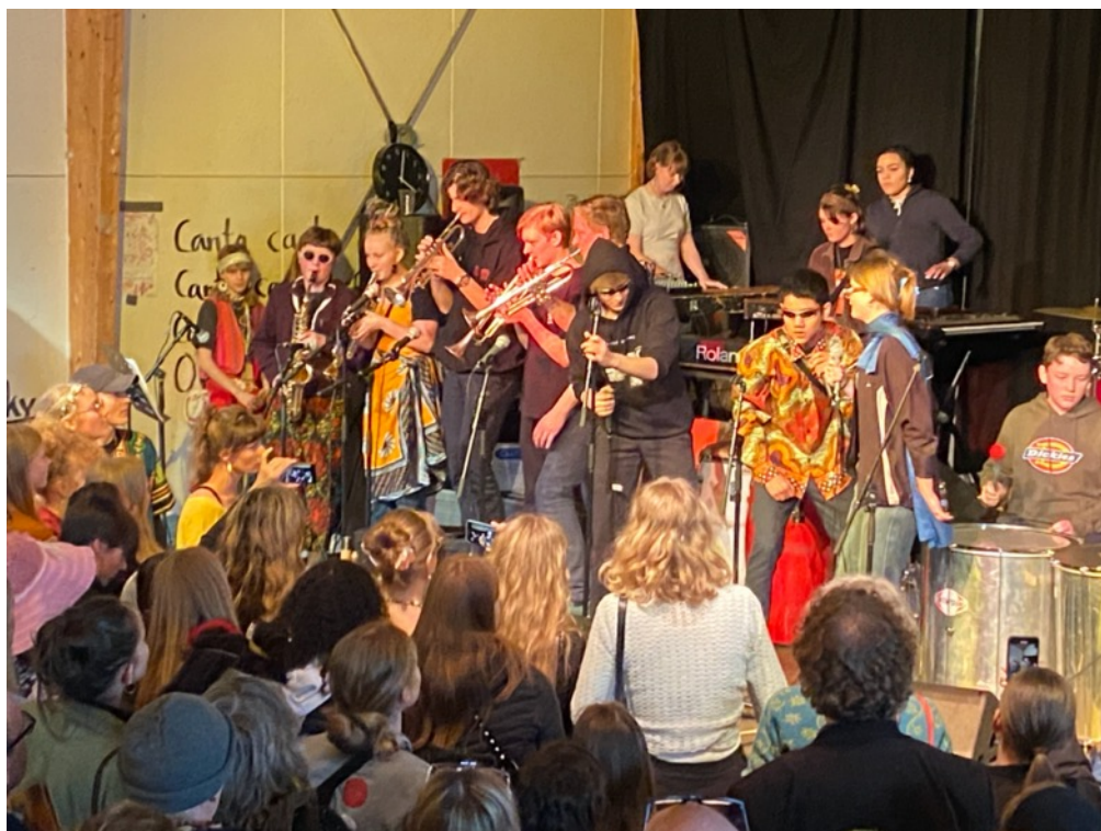
9.klasse spiller til Fastelavn