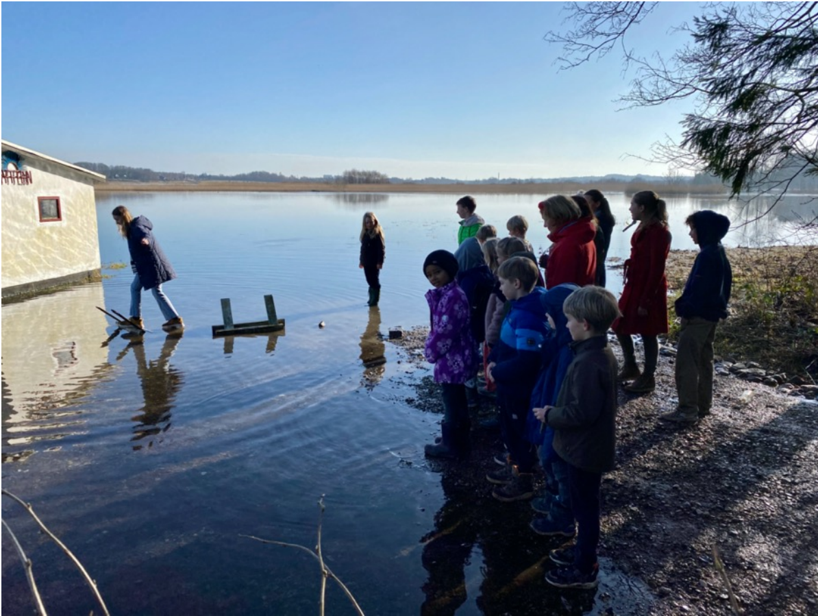
Mange syge børn = små klasser = gå til den opsvulmede sø i solskin☺