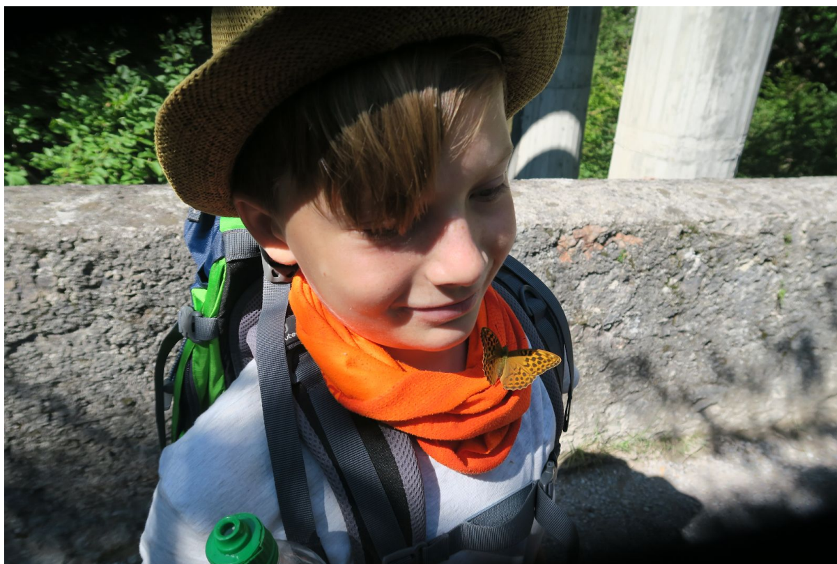
Gammelt billede fra sommeren 2018